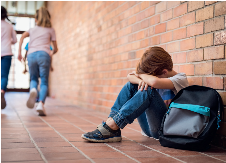
Hat schwere Konsequenzen: Hatespeech an der Schule

H atespeech ist längst kein reines Onlinephänomen mehr. Auch Schulen sehen sich zunehmend mit menschenfeindlichen Äußerungen konfrontiert – ob auf dem Pausenhof oder in WhatsApp-Gruppen. Eine Studie, die wir an der Brandenburgischen Technischen Universität Cottbus-Senftenberg (BTU) zusammen mit Kolleginnen und Kollegen der Universität Potsdam durchgeführt haben, zeigt: Zwei Drittel der