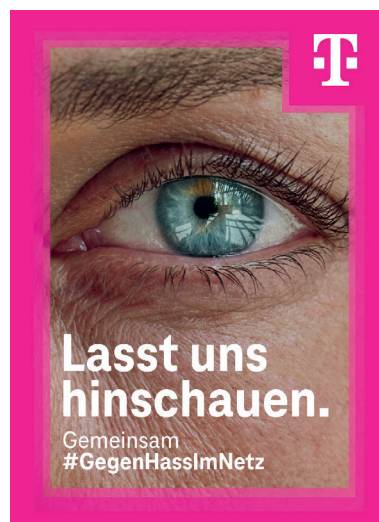
Augen auf – für ein respektvolles Miteinander ohne Hass

Aus Sicht der Telekom heißt das: Vorbild sein, Stärke zeigen, Grenzen setzen und sich für diejenigen einsetzen, die Unterstützung brauchen. Denn jeder könne digitale Zivilcourage vorleben und so andere Menschen vor Hass schützen. Mit Auswirkungen, die weit über das Internet hinausreichen. Denn wie sich Menschen im Netz verhielten, habe nun mal auch Einfluss auf ihr Handeln in der analogen Welt beziehungsweise wie sie innerhalb der Gesellschaft miteinander umgingen. „Hassrede darf nicht zur Normalität werden. Unsere Initiative Gemeinsam #GegenHassImNetz zeigt, dass Marketing Meinungen, Verhaltensweisen und Ergebnisse verändern kann“, betont Telekom-Sprecher Lindlar. Das werde unter anderem auch deutlich an den zahlreichen Anfragen zur Nutzung der Kampagnen-Spots für die Aufklärungsarbeit in Schulen, gemeinnützigen Organisationen oder in der Polizeiarbeit. ●