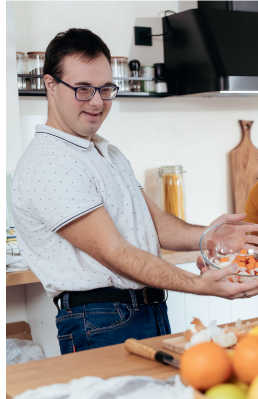
Präsentieren sich Menschen mit Behinderungen auf Social Media, sind sie häufig Opfer von Diskriminierung und Hatespeech.

Die Folgen: Viele Betroffene ziehen sich zurück, posten weniger oder verschwinden ganz aus der digitalen Öffentlichkeit – und mit ihnen wertvolle Stimmen und Perspektiven. Dieser Rückzug ist menschlich nachvollziehbar, doch er verändert den Diskurs: Die Lauten bleiben, die Leisen werden noch leiser oder verschwinden ganz. Vor allem die Menschen, die