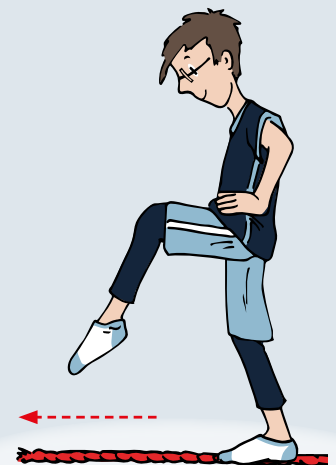
Seiltanzen mit Kniehub Koordination