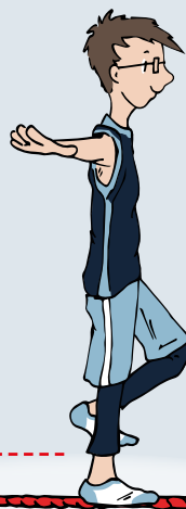
Seiltanzen rückwärts Koordination