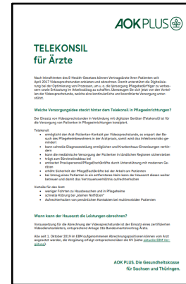
Information für interessierte Ärzte