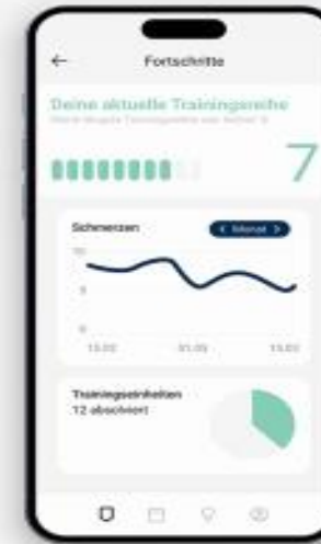
Motivation & Fortschritte