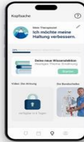
Entspannung und Wissen