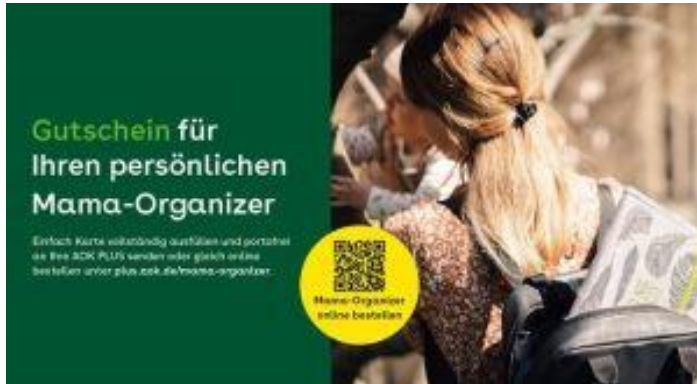
Booklet als Werbemittel