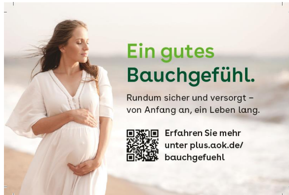
Hinweis über S3C-Schnittstelle