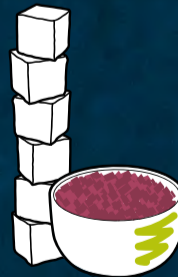
1 Portion zubereiteter Rotkohl (150 g) enthält ca. 6 Zuckerwürfel