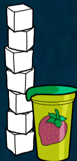
1 Becher Fruchtjoghurt (150 g) enthält ca. 7 Zuckerwürfel

Schauen Sie auf die Nährwerttabelle und rechnen Sie den Zuckeranteil in Würfelzucker um. 3 Gramm Zucker entsprechen einem Stück Würfelzucker. So beinhaltet ein Liter Limonade insgesamt 33 Stück Würfelzucker. Die folgende Grafik verdeutlicht, wie viel Stück Würfelzucker sich in typischen Lebensmitteln befinden: