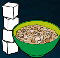
1 Schüssel Knuspermüsli Karamell (50 g) enthält ca. 4 Zuckerwürfel