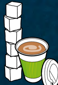
1 Becher Kaffee/Eiskaffeegetränk (250 g) enthält ca. 6 Zuckerwürfel