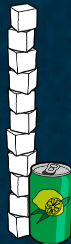
1 Dose Limonade (0,33l) enthält ca. 11 Zuckerwürfel