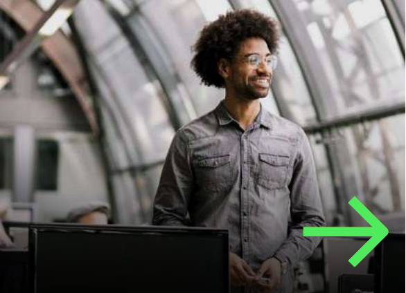
1. Fachkräftemangel in Deutschland