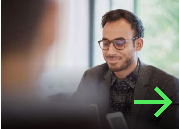
2. Fachkräfte aus Drittstaaten