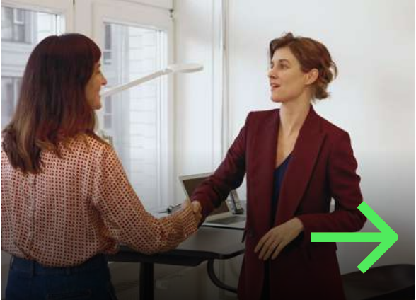
3. Unternehmensinterner Transfer (ICT-Karte)