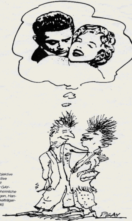
Abb. 1: Objektive und subjektive Wirklichkeit (Aus: Peter GAY- MANN, Unheimliche Begegnungen, Han- nover: Fackelträger- Verlag, 1986)