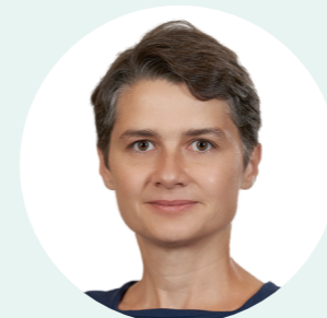
Daniela Kolbe Verwaltungsratsvorsitzende (Versichertenseite)