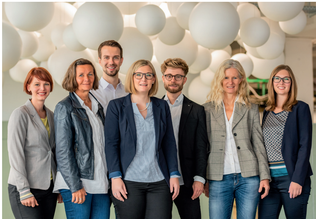
Das AOK-Expertenteam steht Ihnen mit Rat und Tat zur Seite